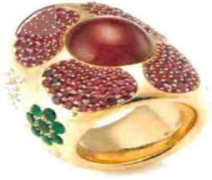
7. Ring; 750/Gelbgold; 1 Rubin-Cabochon, Rubine/Smaragde/Diamanten; Punzzeichen: HORNEMANN

Ring; 18ct./gold; 1 Ruby cabochon; Ruby/Emerald/Diamond; Hallmark: HORNEMANN