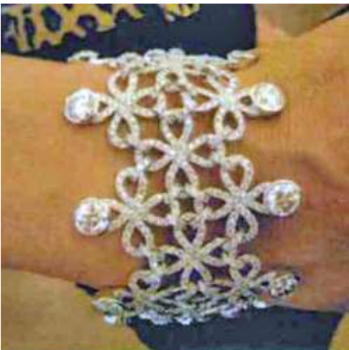
9. Armband; 750/Weißgold; 16 Diamanten und 1162 Diamanten; Punzzeichen: HORNEMANN

Ring; 18ct./white gold; white/black/yellow Diamonds; Hallmark: HORNEMANN