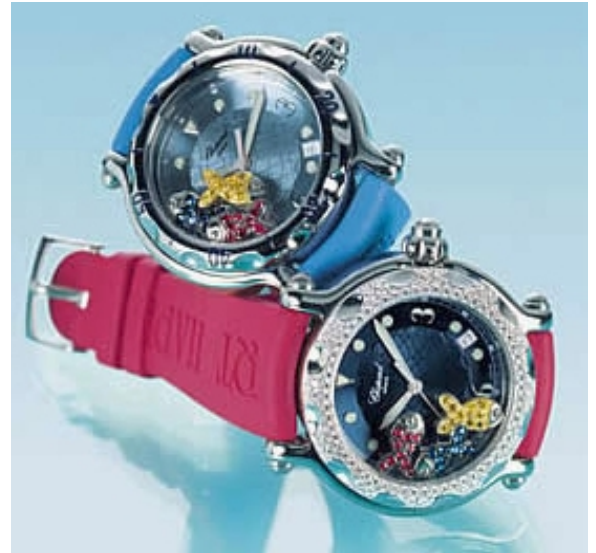
Typ: Damenarmbanduhr Hersteller: Chopard Model: Happy Sport Material: 750 GG Serien-Nr. 28/8914-8 Individualnr. 931349-8914/8