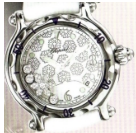
Typ: Damenarmbanduhr Hersteller: Chopard Model: Happy Sport Snowflake Material: Edelstahl Serien-Nr. 28/8948 Individualnr. 1001217