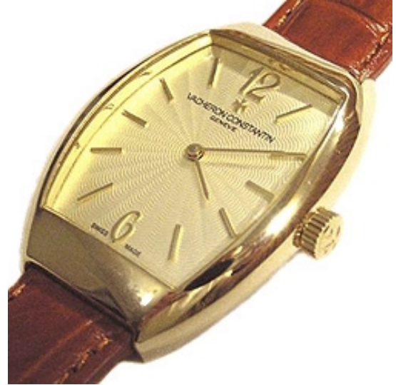
Typ: Damenarmbanduhr Hersteller: Vacheron Constantin Modell: Egerie Material: 750 GG Serien-Nr. X25J5698 Individualnr. 776864vac