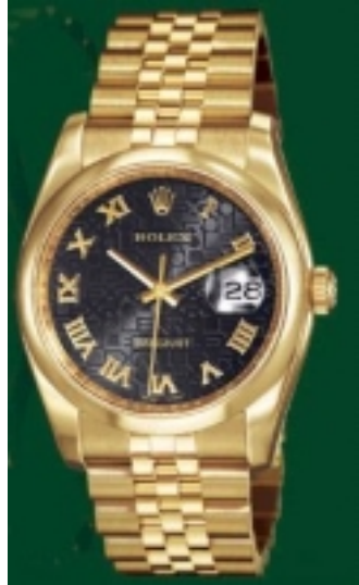
Typ: Herrenarmbanduhr Hersteller: Rolex Modell: Datejust Material: 750 GG Serien-Nr. 116208-63208 Individualnr. F645955