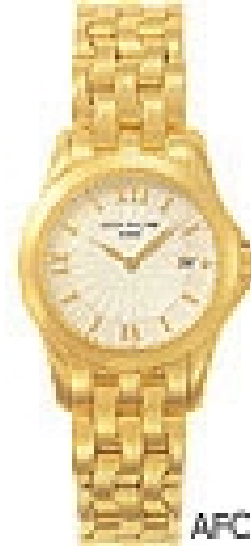
Typ: Damenarmbanduhr Hersteller: Patek Philippe Model: Calatrava Material: 750 GG Serien-Nr. 4906/101J-00 Individualnr. 33202264273572