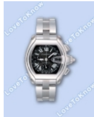
Typ: Chronograph Hersteller: Cartier Modell: Roadster Material: Edelmetall Serien-Nr. W62007X6 Individualnr. 2618557158CE