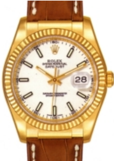
Typ: Herrenarmbanduhr Hersteller: Rolex Modell: Datejust Material: 750 GG Serien-Nr. 116138 Individualnr. F831960