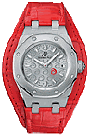
Typ: Damenarmbanduhr Hersteller: Audemars Piguet Modell: Royal Oak Alinghi Material: Edeldstahl Serien-Nr. 67610ST.00.D062CR.01 Individualnr. F20492