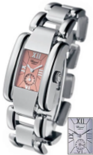
Typ: Damenarmbanduhr Hersteller: Chopard Model: La Strada Material: Edelstahl Serien-Nr. 41/8380 Individualnr. 8761725-8357