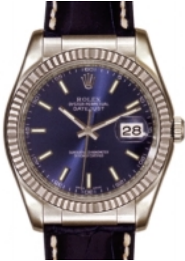
Typ: Herrenarmbanduhr Hersteller: Rolex Modell: Datejust Material: 750 WG Serien-Nr. 116139 Individualnr. F625610