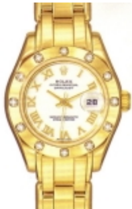
Typ: Damenarmbanduhr Hersteller: Rolex Modell: Lady-Datejust Pearlmaster Material: 750 GG Serien-Nr. 80318-72948 Individualnr. K590574