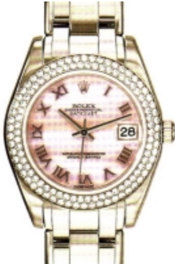
Typ: Damenarmbanduhr Hersteller: Rolex Modell: Datejust Special Edition Material: 750 WG Serien-Nr. 81339-72849 Individualnr. K566954