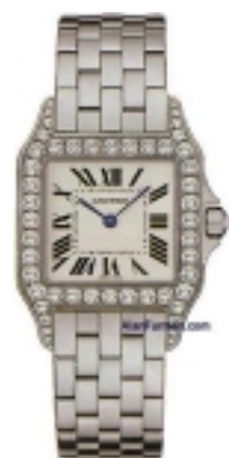
Typ: Damenarmbanduhr Hersteller: Cartier Modell: Santos Mademoiselle Material: 750 WG Serien-Nr. WF9004Y8 Individualnr. 2703288317CE