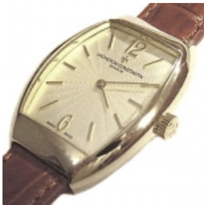
Typ: Damenarmbanduhr Hersteller: Vacheron Constantin Modell: Egerie Material: 750 WG Serien-Nr. X25G5697 Individualnr. 777177vac