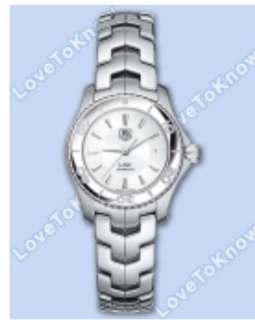
Typ: Damenarmbanduhr Hersteller: Tag Heuer Modell: Link Material: Edelstahl Serien-Nr. WJ1310.BA0571 Individualnr. keine