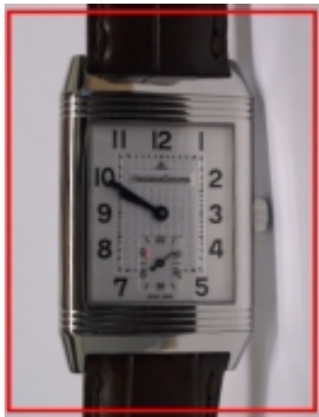
Typ: Herrenarmbanduhr Hersteller: Jaeger LeCoultre Modell: Reverso Grande Taille Material: Edelstahl Serien-Nr. 2708410 Individualnr. 2212390