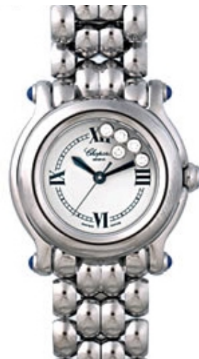
Typ: Damenarmbanduhr Hersteller: Chopard Modell: Happy Sport Material: Edelstahl Serien-Nr. 27/8250-23 Individualnr. 975364