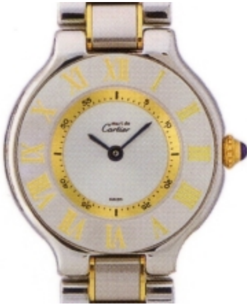
Typ: Herrenarmbanduhr Hersteller: Cartier Model: 21 Must Material: 750 GG Serien-Nr. W10072R6 Individualnr. 1340PL325673