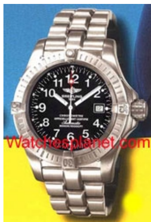
Typ: Herrenarmbanduhr Hersteller: Breitling Modell: Avenger Sea Wolf Material: Titan Serien-Nr. A17390-178 Individualnr. 875810