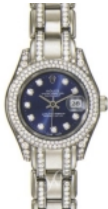
Typ: Damenarmbanduhr Hersteller: Rolex Modell: Lady-Datejust Pearlmaster Material: 750 WG Serien-Nr. 80359-74949 Individualnr. P193838