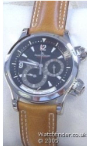
Typ: Herrenarmbanduhr Hersteller: Jaeger LeCoultre Modell: Master Compressor Material: Edelmetall Serien-Nr. 1718470 Individualnr. 0150