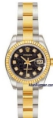
Typ: Damenarmbanduhr Hersteller: Rolex Modell: Lady-Datejust Material: 750 GG Serien-Nr. 179173-72133 Individualnr. F569409