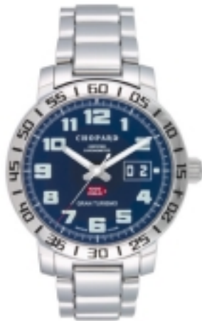
Typ: Herrenarmbanduhr Hersteller: Chopard Model: Mille Miglia Material: Edeldstahl Serien-Nr. 15/8955 Individualnr. 1024481