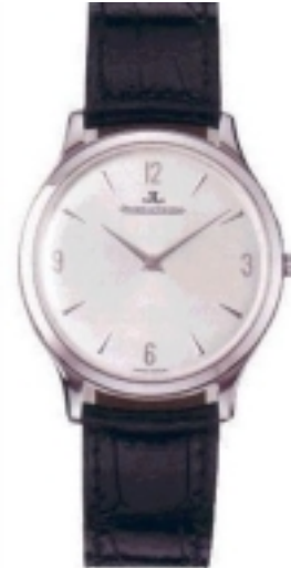
Typ: Herrenarmbanduhr Hersteller: Jaeger LeCoultre Modell: Master Ultra Thin Material: Edelmetall Serien-Nr. 1458404 Individualnr. 2947