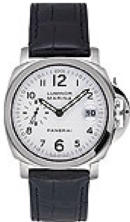
Typ: Herrenarmbanduhr Hersteller: Panerai Modell: Luminor Marina 40mm Material: Edelstahl Serien-Nr. PAM00049 Individualnr. OP6560BB 1126928