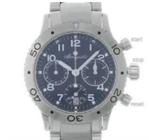
Typ: Chronograph Hersteller: Breguet Modell: XX Transatlantique Material: Edelmetall Serien-Nr. 4820STDS576 Individualnr. keine