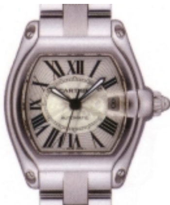
Typ: Herrenarmbanduhr Hersteller: Cartier Modell: Roadster Material: Edelmetall Serien-Nr. W62025V3 Individualnr. 2510229311CE