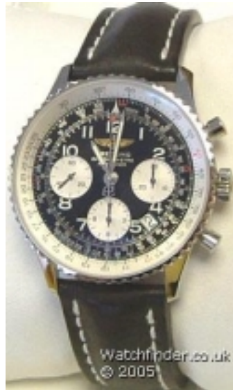
Typ: Herrenarmbanduhr Hersteller: Breitling Modell: Navy Timer Material: Edelstahl Serien-Nr. A23322-161 Individualnr. 779176