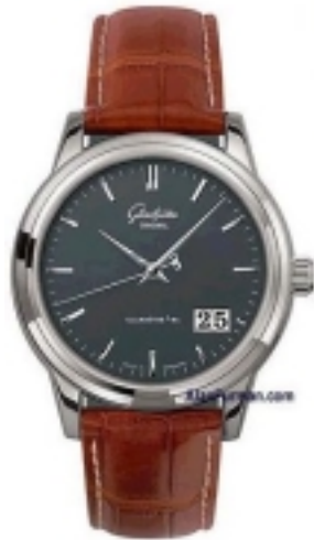
Typ: Herrenarmbanduhr Hersteller: Glashütte Modell: Senator Material: Edelstahl Serien-Nr. 39.42.14.24.04 Individualnr. 157