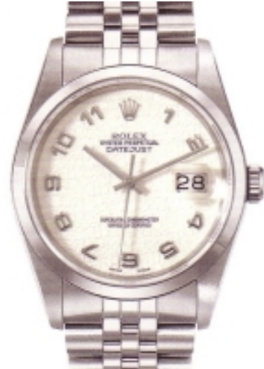
Typ: Herrenarmbanduhr Hersteller: Rolex Modell: Datejust Material: Edelstahl Serien-Nr. 16200-78360 Individualnr. F487971