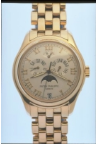
Typ: Herrenarmbanduhr Hersteller: Patek Philippe Model: Rattrapante Material: 750 RG Serien-Nr. 5036/1R-001 Individualnr. 32873824260397