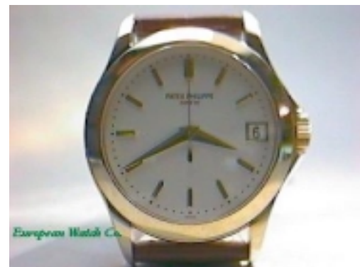
Typ: Herrenarmbanduhr Hersteller: Patek Philippe Modell: Calatrava Material: 750 GG Serien-Nr. 5107J-001 Individualnr. 32526744202906