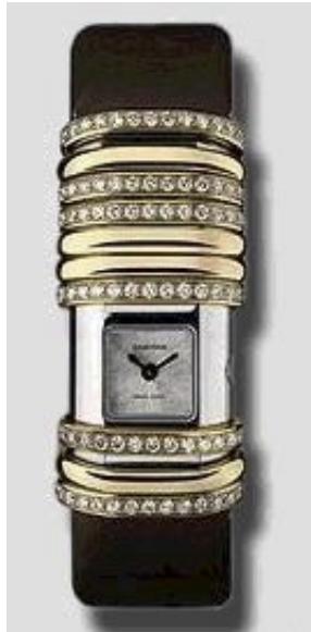
Typ: Damenarmbanduhr Hersteller: Cartier Modell: Declaration Material: Titan & 750 GG Serien-Nr. WT000150 Individualnr. 261180098CE