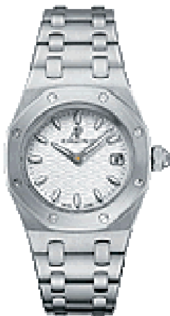
Typ: Damenarmbanduhr Hersteller: Audemars Piguet Modell: Royal Oak Material: Edeldstahl Serien-Nr. 67600ST.00.1210ST.01 Individualnr. F15774-0172