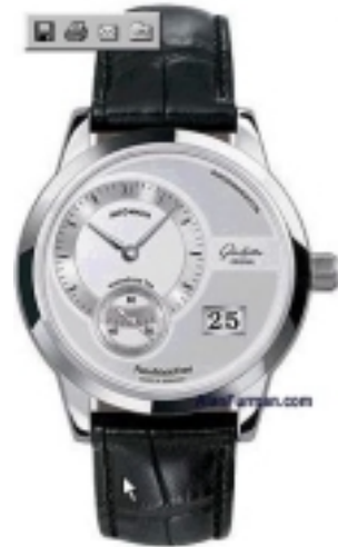
Typ: Herrenarmbanduhr Hersteller: Glashütte Modell: PanoMaticDate Material: Edelstahl Serien-Nr. 90.01.02.02.04 Individualnr. keine