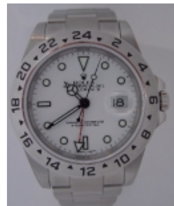
Typ: Herrenarmbanduhr Hersteller: Rolex Modell: Prof. Explorer Material: Edelmetall Serien-Nr. 16570-78790 Individualnr. F4602205