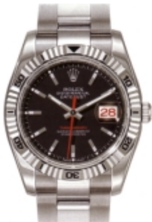
Typ: Herrenarmbanduhr Hersteller: Rolex Modell: Datejust Turn-O-Graph Material: 750 WG Serien-Nr. 116264-72200 Individualnr. F818809