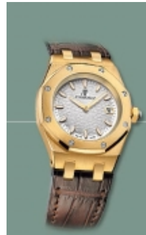
Typ: Damenarmbanduhr Hersteller: Audemars Piguet Modell: Royal Oak Material: 750 GG Serien-Nr. 67600BA.00.D090CR.01 Individualnr. F17853-0255