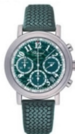
Typ: Chronograph Hersteller: Chopard Modell: Elton John Material: Edelstahl Serien-Nr. 16/8331 Individualnr. 1054626-8331-52