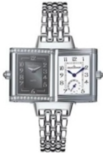
Typ: Herrenarmbanduhr Hersteller: Jaeger LeCoultre Modell: Reverso Material: Edelstahl Serien-Nr. 2568101 Individualnr. 2220064