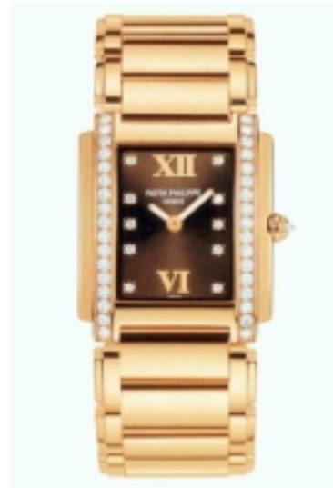
Typ: Damenarmbanduhr Hersteller: Patek Philippe Modell: Twenty-4 Medium Material: 750 RG Serien-Nr. 4910/11R-010 Individualnr. 3292392