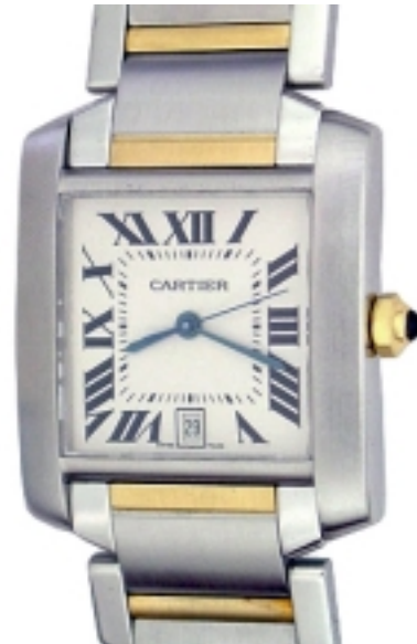
Typ: Herrenarmbanduhr Hersteller: Cartier Modell: Tank Françoise Material: 750 GG Serien-Nr. W51005Q4 Individualnr. 2302462434CE