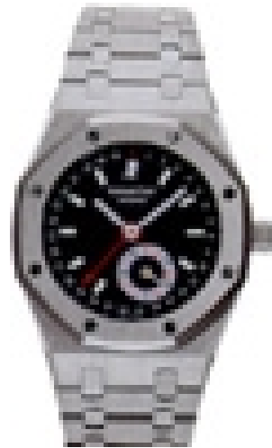
Typ: Chronograph Hersteller: Audemars Piguet Modell: Royal Oak Material: Edeltahl Serien-Nr. 25920ST.0.0789ST.01 Individualnr. E20512.158