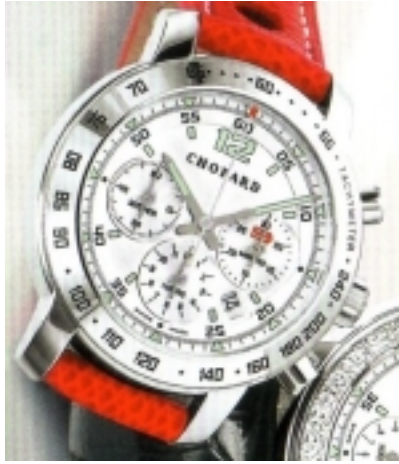
Typ: Herrenarmbanduhr Hersteller: Chopard Model: Mille Miglia Material: Edeldstahl Serien-Nr. 16/8933 Individualnr. 967494