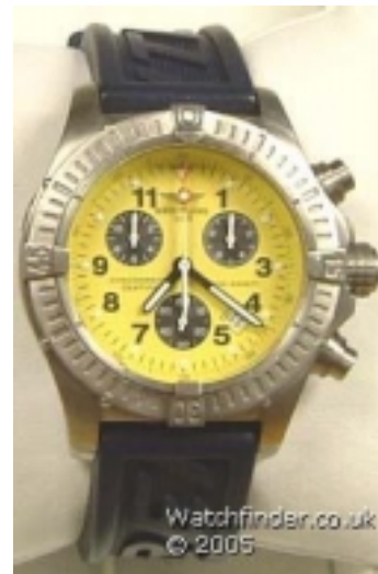
Typ: Chronograph Hersteller: Breitling Modell: Avenges M1 Material: Titan Serien-Nr. E73360 Individualnr. 654065