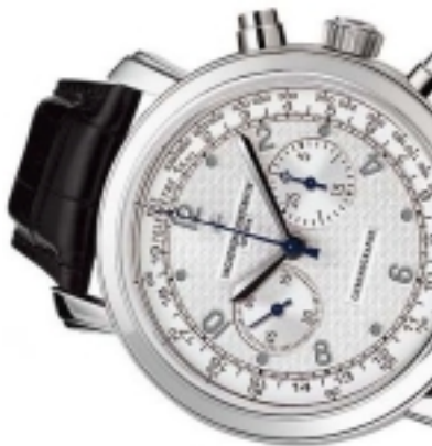
Typ: Chronograph Hersteller: Vacheron Constantin Modell: Malte Material: Edelstahl Serien-Nr. X49A6955 Individualnr. 786653vac