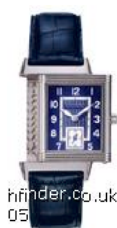
Typ: Herrenarmbanduhr Hersteller: Jaeger LeCoultre Modell: Reverso Material: Edelstahl Serien-Nr. 2708481 Individualnr. 2141163