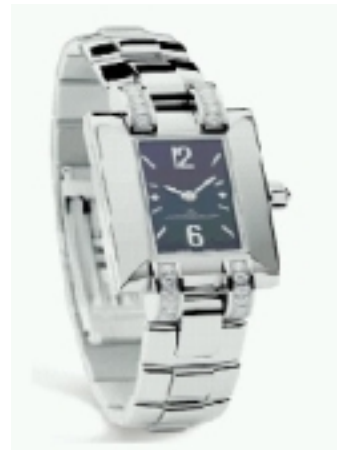
Typ: Damenarmbanduhr Hersteller: Jaeger LeCoultre Modell: Ideale Material: Edelstahl Serien-Nr. 4608171 Individualnr. 2363039