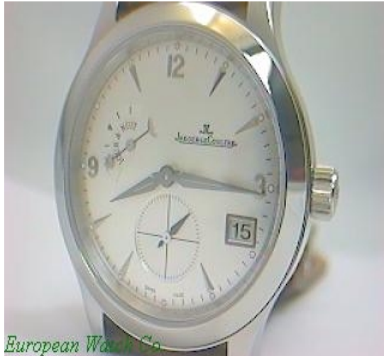
Typ: Herrenarmbanduhr Hersteller: Jaeger LeCoultre Modell: Master Material: Edelmetall Serien-Nr. 1628420 Individualnr. 1346