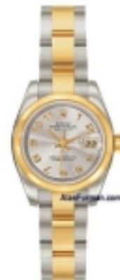
Typ: Damenarmbanduhr Hersteller: Rolex Modell: Lady-Datejust Material: 750 GG Serien-Nr. 179163-72133 Individualnr. F673748