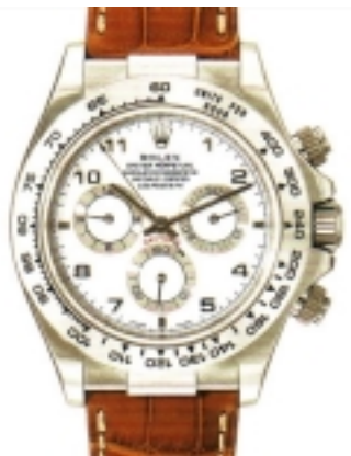
Typ: Chronograph Hersteller: Rolex Modell: Cosmograph Daytona Material: 750 WG Serien-Nr. 116519 Individualnr. F014564