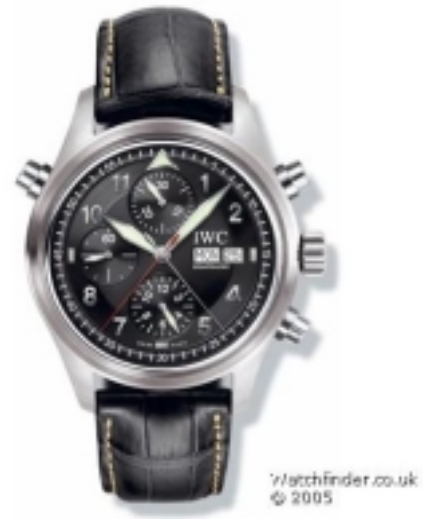
Typ: Chronograph Hersteller: IWC Modell: Double Chrono Material: Edelstahl Serien-Nr. IW371331 Individualnr. 2951080