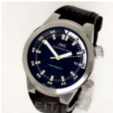
Typ: Herrenarmbanduhr Hersteller: IWC Modell: Aquatimer Material: Edelstahl Serien-Nr. IW354804 Individualnr. 3032784