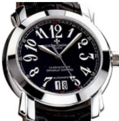
Typ: Herrenarmbanduhr Hersteller: Vacheron Constantin Modell: Malte Big Date Material: 750 WG Serien-Nr. X42G4963 Individualnr. 741192vac