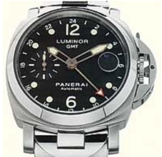
Typ: Herrenarmbanduhr Hersteller: Panerai Modell: GMT Material: Edelstahl Serien-Nr. PAM00160 Individualnr. OP6594BB 1118078