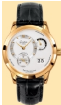
Typ: Herrenarmbanduhr Hersteller: Glashütte Modell: PanoMaticReserve Material: 750 GG Serien-Nr. 90.03.01.01.04 Individualnr. 16