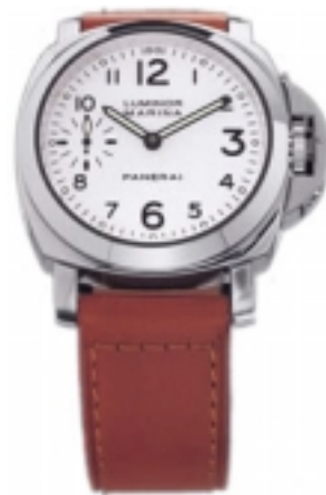
Typ: Herrenarmbanduhr Hersteller: Panerai Modell: Luminor Marina 40mm Material: Edelstahl Serien-Nr. PAM00113 Individualnr. OP6567BB 1098710