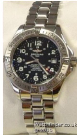
Typ: Herrenarmbanduhr Hersteller: Breitling Modell: Superocean Steel Fish Material: Edelstahl Serien-Nr. A17360-378 Individualnr. 736560