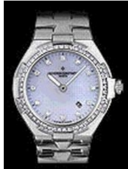
Typ: Damenarmbanduhr Hersteller: Vacheron Constantin Modell: Overseas Small Material: Edelstahl Serien-Nr. X25A6949 Individualnr. 785173vac