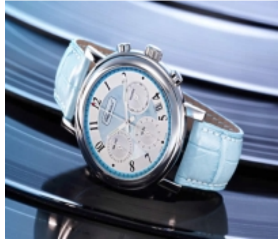
Typ: Chronograph Hersteller: Chopard Model: Elton John Turquoise Material: Edeldstahl Serien-Nr. 16/8331-13 Individualnr. 1054821