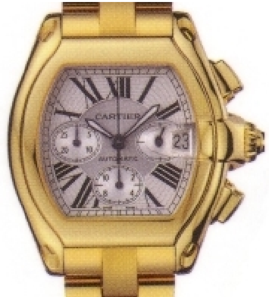
Typ: Chronograph Hersteller: Cartier Model: Roadster Material: 750 GG Serien-Nr. W62021Y2 Individualnr. 261961967CE