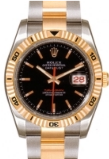
Typ: Herrenarmbanduhr Hersteller: Rolex Modell: Day-Date II Turn-O-Graph Material: 750 RG Serien-Nr. 116261-63202 Individualnr. F738202