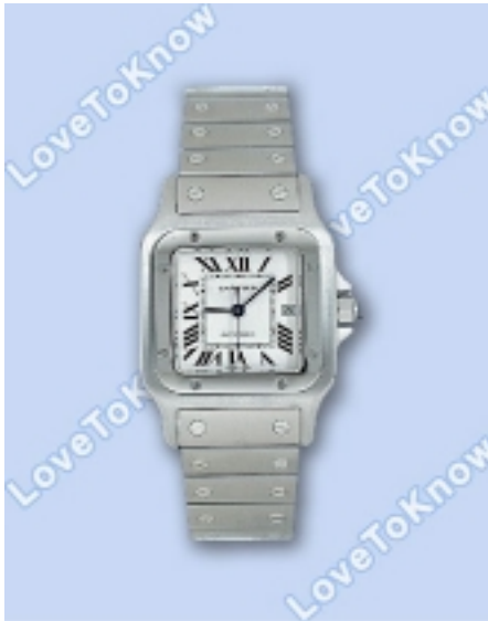
Typ: Herremarmbanduhr Hersteller: Cartier Modell: Santos Material: Edelmetall Serien-Nr. W20055D6 Individualnr. 319666039CD