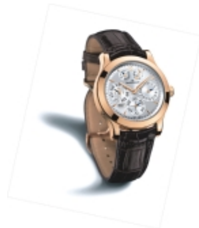
Typ: Herrenarmbanduhr Hersteller: Jaeger LeCoultre Modell: MasterEightDay Perpetual Material: 750 GG Serien-Nr. 161242D Individualnr. keine