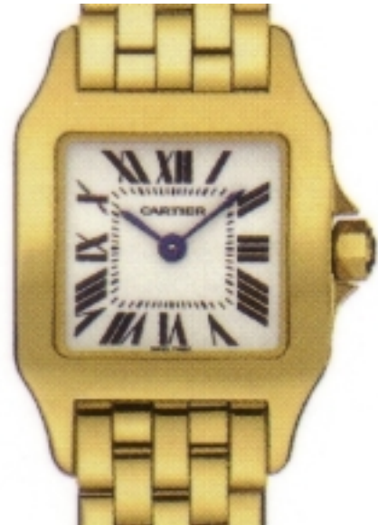
Typ: Damenarmbanduhr Hersteller: Cartier Modell: Santos Mademoiselle Material: 750 GG Serien-Nr. W25063X9 Individualnr. 269978088CE