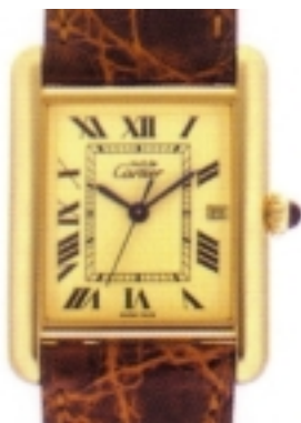
Typ: Damenarmbanduhr Hersteller: Cartier Modell: Tank Must Material: Platin Serien-Nr. W1017454 Individualnr. 2413158356PL & Individualnr. 2413158713PL