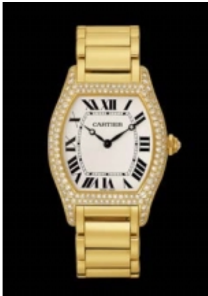
Typ: Damenarmbanduhr Hersteller: Cartier Modell: Tortue Material: 750 GG Serien-Nr. WA5048W8 Individualnr. 264386990CE