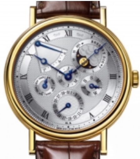
Typ: Herrenarmbanduhr Hersteller: Breguet Modell: Perpetual Classic Material: 750 GG Serien-Nr. 5327BA1E9V6 Individualnr. 968R