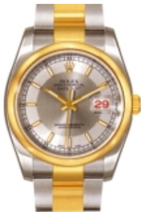
Typ: Herrenarmbanduhr Hersteller: Rolex Modell: Datejust Material: 750 GG Serien-Nr. 116203-72203 Individualnr. F538988 & Individualnr. F397791