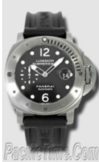
Typ: Herrenarmbanduhr Hersteller: Panerai Modell: Luminor Submersible Material: Titan Serien-Nr. PAM00025 Individualnr. OP62BB 1042227