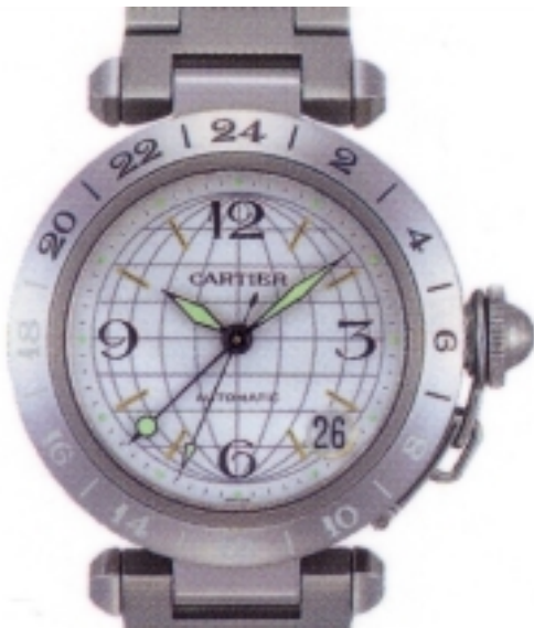
Typ: Herrenarmbanduhr Hersteller: Cartier Modell: Pasha C Material: Edelmetall Serien-Nr. W31029M7 Individualnr. 2377820599UF