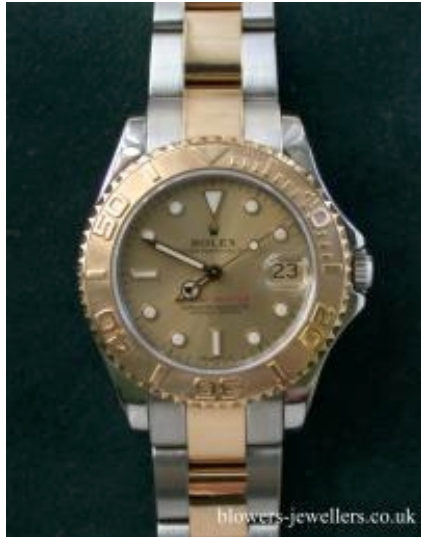
Typ: Damenarmbanduhr Hersteller: Rolex Modell: Yacht-Master Material: 750 GG Serien-Nr. 168623-78753 Individualnr. F254304