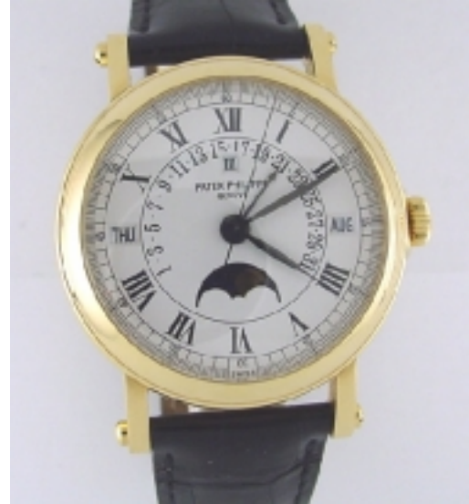
Typ: Herrenarmbanduhr Hersteller: Patek Philippe Model: Perpetual Material: 750 GG Serien-Nr. 5059J/011 Individualnr. 32357194147370