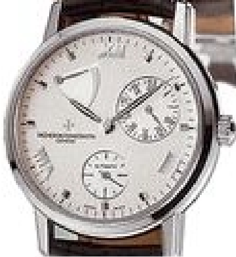
Typ: Herrenarmbanduhr Hersteller: Vacheron Constantin Modell: Power Reserve Material: 750 WG Serien-Nr. X47G5350 Individualnr. 779240vac