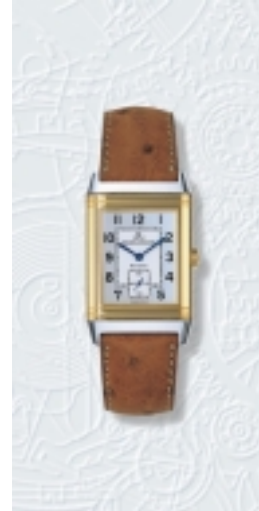
Typ: Herrenarmbanduhr Hersteller: Jaeger LeCoultre Modell: Reverso Grande Taille Material: 750 GG Serien-Nr. 2705410 Individualnr. 2213412