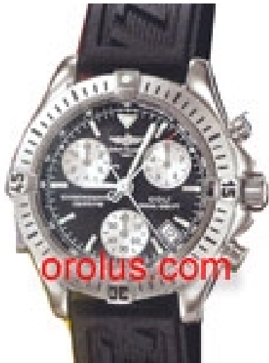
Typ: Chronograph Hersteller: Breitling Modell: Colt Material: Edelstahl Serien-Nr. A73350 Individualnr. 750320