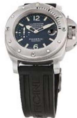
Typ: Herrenarmbanduhr Hersteller: Panerai Modell: Luminor Submersible Material: Titan Serien-Nr. PAM00087 Individualnr. OP6541BB 1115247