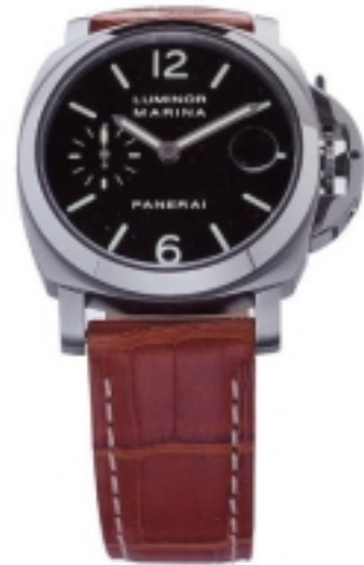
Typ: Herrenarmbanduhr Hersteller: Panerai Modell: Luminor Marina 40mm Material: Edelstahl Serien-Nr. PAM00048 Individualnr. OP6560BB 1110861