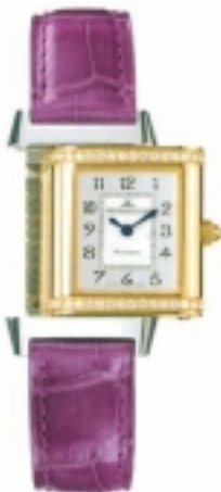
Typ: Damenarmbanduhr Hersteller: Jaeger LeCoultre Modell: Reverso Material: 750 GG Serien-Nr. 2655420 Individualnr. 2124406