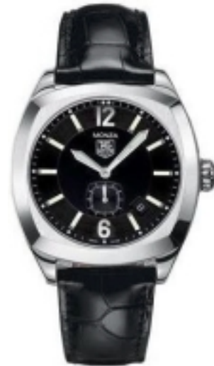
Typ: Herrenarmbanduhr Hersteller: Tag Heuer Modell: Monza Automatic Material: Edelstahl Serien-Nr. WR2110.FC6164 Individualnr. keine