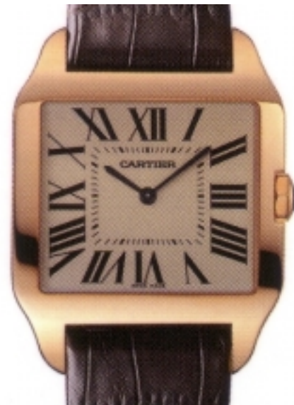
Typ: Herrenarmbanduhr Hersteller: Cartier Modell: Santos Diamant Material: 750 RG Serien-Nr. W2006951 Individualnr. 2650368721CE