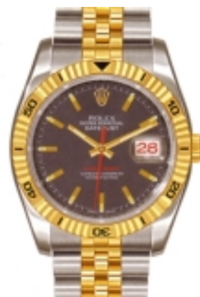
Typ: Herrenarmbanduhr Hersteller: Rolex Modell: Datejust Turn-O-Graph Material: 750 GG Serien-Nr. 116263-63203 Individualnr. F330307 & Individualnr. F424488