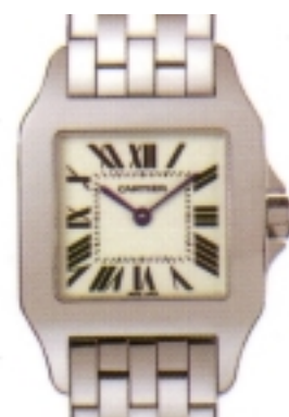
Typ: Damenarmbanduhr Hersteller: Cartier Modell: Santos Mademoiselle Material: Edelmetall Serien-Nr. W25065Z5 Individualnr. 2701579398PB