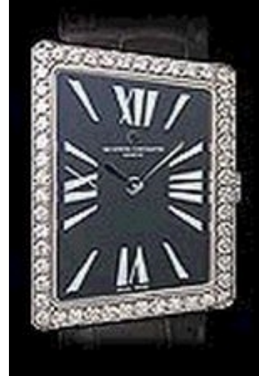
Typ: Herrenarmbanduhr Hersteller: Vacheron Constantin Modell: Asymetric 1972 Material: 750 WG Serien-Nr. X37G4859 Individualnr. 739465vac