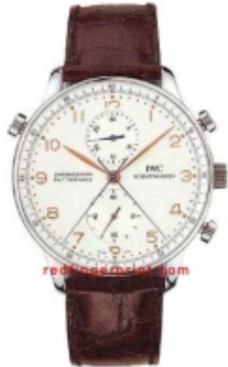
Typ: Chronograph Hersteller: IWC Modell: Portugieser Split Seconds Material: Edelstahl Serien-Nr. IW371201 Individualnr. keine