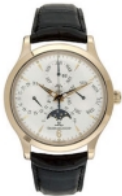
Typ: Herrenarmbanduhr Hersteller: Jaeger LeCoultre Modell: Master Watch Material: 750 RG Serien-Nr. 149242D Individualnr. 1014