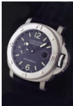
Typ: Herrenarmbanduhr Hersteller: Panerai Modell: Luminor Arktos Material: Edelstahl Serien-Nr. PAM00092 Individualnr. OP6559BB 1112257