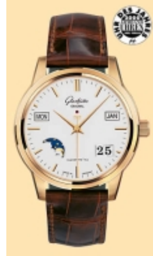
Typ: Herrenarmbanduhr Hersteller: Glashütte Modell: Senator Material: 750 RG Serien-Nr. 39.50.01.11.04 Individualnr. keine