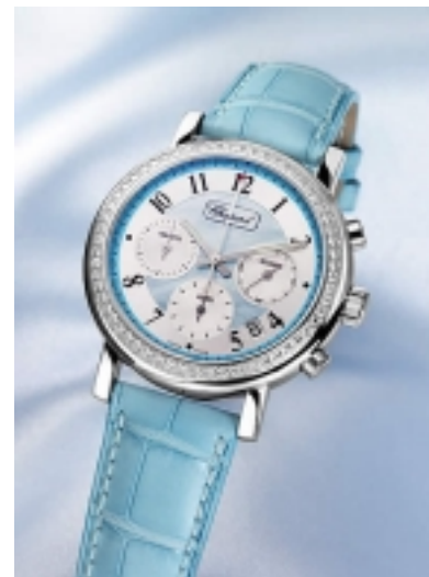
Typ: Chronograph Hersteller: Chopard Model: Elton John Turquoise Material: 750 WG Serien-Nr. 16/8331-13-20 Individualnr. 1064159-8947-58