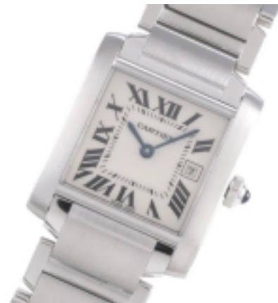
Typ: Herrenarmbanduhr Hersteller: Cartier Modell: Tank Françoise Material: Edelstahl Serien-Nr. W51011Q3 Individualnr. 2465630851CE