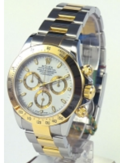
Typ: Chronograph Hersteller: Rolex Modell: Cosmograph Daytona Material: 750 GG Serien-Nr. 116523-78493 Individualnr. F448800