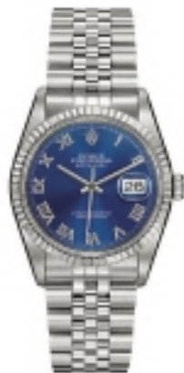
Typ: Herrenarmbanduhr Hersteller: Rolex Modell: Datejust Material: 750 WG1 Serien-Nr. 16234-62510H Individualnr. F668738