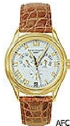
Typ: Herrenarmbanduhr Hersteller: Patek Philippe Modell: Calatrava Travel Time Material: 750 WG Serien-Nr. 5120/1G-001 Individualnr. 12061064243264