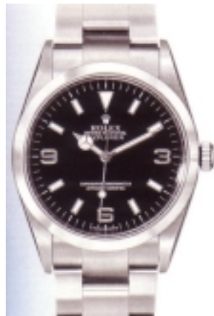
Typ: Herrenarmbanduhr Hersteller: Rolex Modell: Explorer Material: Edelstahl Serien-Nr. 114270-78690 Individualnr. F650131