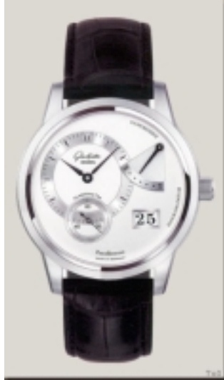
Typ: Herrenarmbanduhr Hersteller: Glashütte Modell: PanoReserve Material: Edelstahl Serien-Nr. 65.01.02.02.04 Individualnr. 599