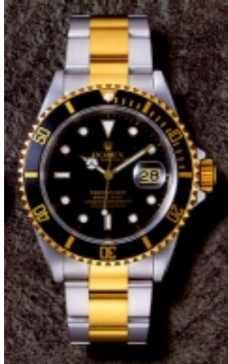
Typ: Herrenarmbanduhr Hersteller: Rolex Modell: Submariner-Date Material: 750 GG Serien-Nr. 16613-93253 Individualnr. F667647