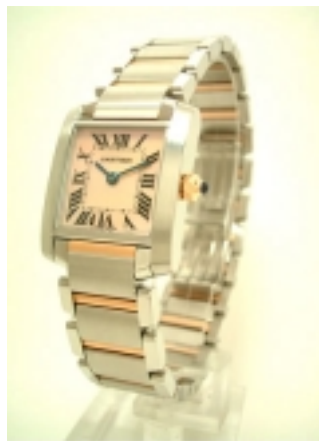
Typ: Damenarmbanduhr Hersteller: Cartier Modell: Tank Françoise Material: 750 RG Serien-Nr. W51027Q4 Individualnr. 2384802646UF