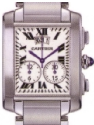
Typ: Chronograph Hersteller: Cartier Model: Tank Françoise Material: Edelfstahl Serien-Nr. W51024Q3 Individualnr. 2653485526CE