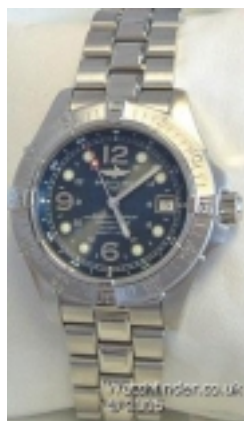
Typ: Herrenarmbanduhr Hersteller: Breitling Modell: Superocean Steel Fish Material: Edelstahl Serien-Nr. A17360-3014 Individualnr. 738047