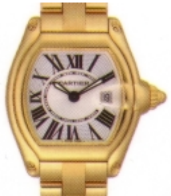
Typ: Damenarmbanduhr Hersteller: Cartier Modell: Roadster Material: 750 GG Serien-Nr. W62018V1 Individualnr. 267660630CE