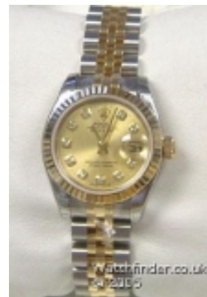
Typ: Damenarmbanduhr Hersteller: Rolex Modell: Lady-Datejust Material: 750 GG Serien-Nr. 179173-63133 Individualnr. F575694