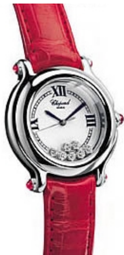
Typ: Damenarmbanduhr Hersteller: Chopard Modell: Happy Sport Material: Edelstahl Serien-Nr. 27/8238-23 Individualnr. 803032