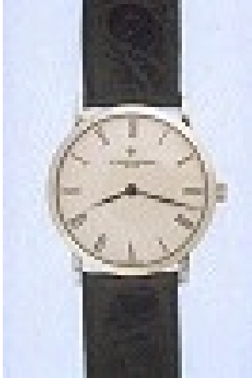
Typ: Herrenarmbanduhr Hersteller: Vacheron Constantin Modell: Patrimony Material: 750 WG Serien-Nr. X33G0403 Individualnr. 741850vac