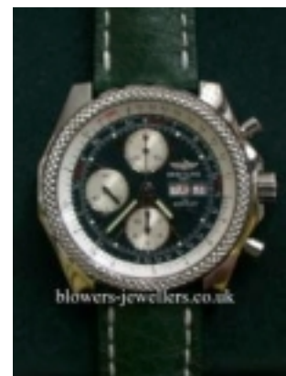
Typ: Herrenarmbanduhr Hersteller: Breitling Modell: Bentley GT Material: Edelstahl Serien-Nr. A13362-131 Individualnr. keine