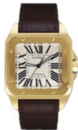
Typ: Herrenarmbanduhr Hersteller: Cartier Modell: Santos 100 Material: 750 WG Serien-Nr. W20071Y1 Individualnr. 657294658