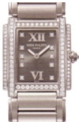
Typ: Damenarmbanduhr Hersteller: Patek Philippe Modell: Twenty-4 Small Material: 750 WG Serien-Nr. 4908/200G-01 Individualnr. 33023494189654