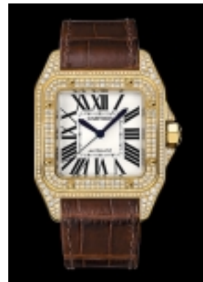
Typ: Damenarmbanduhr Hersteller: Cartier Modell: Santos 100 Material: 750 WG Serien-Nr. WM500351 Individualnr. 274486612CE