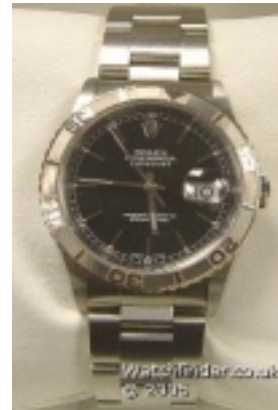
Typ: Herrenarmbanduhr Hersteller: Rolex Modell: Datejust Turn-O-Graph Material: 750 WG Serien-Nr. 116264-63200 Individualnr. F544074