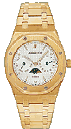
Typ: Herrenarmbanduhr Hersteller: Audemars Piguet Modell: Royal Oak Material: 750 GG Serien-Nr. 25594BA.00.0789.BA.05 Individualnr. E93356