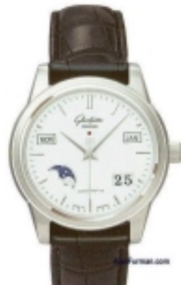
Typ: Herrenarmbanduhr Hersteller: Glashütte Modell: Senator Material: Edelstahl Serien-Nr. 39.50.02.12.04 Individualnr. keine