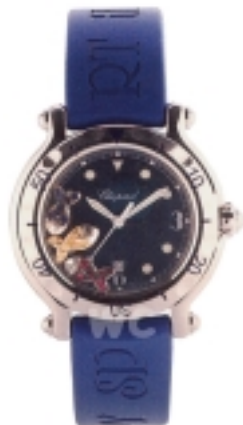
Typ: Damenarmbanduhr Hersteller: Chopard Model: Happy Sport Material: Edelstahl Serien-Nr. 27/8921-402 Individualnr. 945190-8921