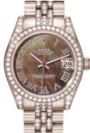
Typ: Damenarmbanduhr Hersteller: Rolex Modell: Datejust with Brilliants Material: 750 WG Serien-Nr. 178159-83169 Individualnr. K577363