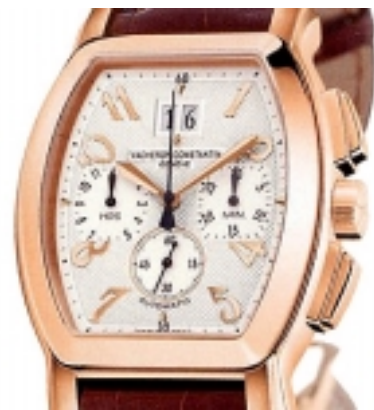
Typ: Chronograph Hersteller: Vacheron Constantin Modell: Roy Eagle Material: 750 RG Serien-Nr. X49R5715 Individualnr. 782915vac