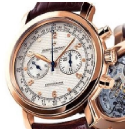
Typ: Chronograph Hersteller: Vacheron Constantin Modell: Malte Material: 750 RG Serien-Nr. X47R6957 Individualnr. 798246vac