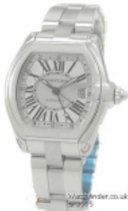
Typ: Damenarmbanduhr Hersteller: Cartier Modell: Roadster Material: Edelstahl Serien-Nr. W62032X6 Individualnr. 2722748472CE