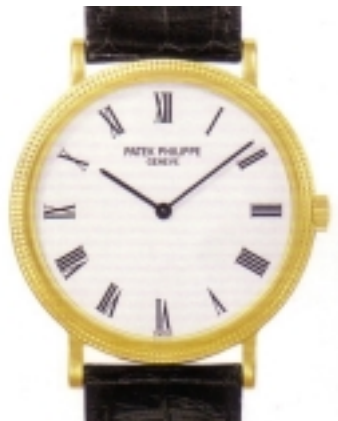
Typ: Herrenarmbanduhr Hersteller: Patek Philippe Modell: Calatrava Travel Time Material: 750 RG Serien-Nr. 5134R-001 Individualnr. 3085210