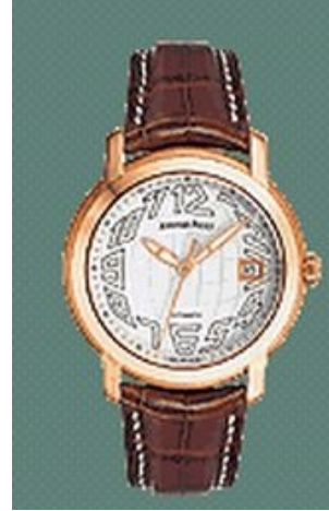
Typ: Herrenarmbanduhr Hersteller: Audemars Piguet Modell: Jules Audemars Material: 750 RG Serien-Nr. 15120OR.00.A088CR.02 Individualnr. F06713