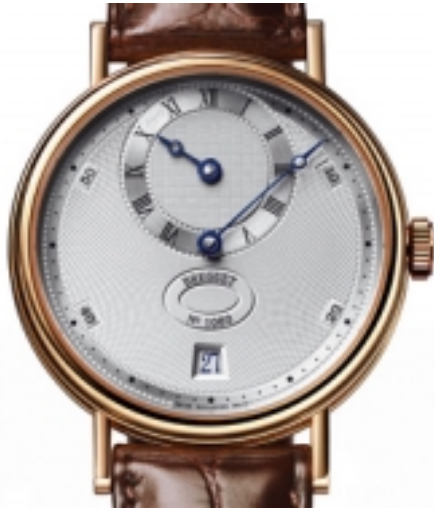
Typ: Herrenarmbanduhr Hersteller: Breguet Modell: Regulator Material: 750 RG Serien-Nr. 5187BR15986 Individualnr. 1146R