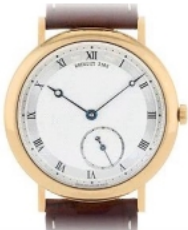
Typ: Herrenarmbanduhr Hersteller: Breguet Modell: Montre Classic Material: 750 GG Serien-Nr. 5140BA299 Individualnr. keine