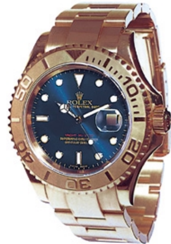
Typ: Herrenarmbanduhr Hersteller: Rolex Modell: Yacht-Master Material: 750 GG Serien-Nr. 16628-78768 Individualnr. Y636659