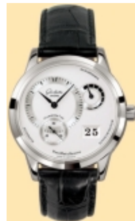
Typ: Herrenarmbanduhr Hersteller: Glashütte Modell: PanoMaticReserve Material: Edelstahl Serien-Nr. 90.03.02.02.04 Individualnr. 5