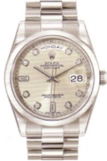
Typ: Herrenarmbanduhr Hersteller: Rolex Modell: Day-Date Material: Platin Serien-Nr. 118206-83206 Individualnr. K556650