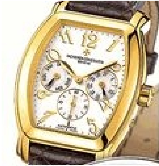
Typ: Chronograph Hersteller: Vacheron Constantin Modell: Roy Eagle Material: 750 GG Serien-Nr. X42J5719 Individualnr. 782230vac