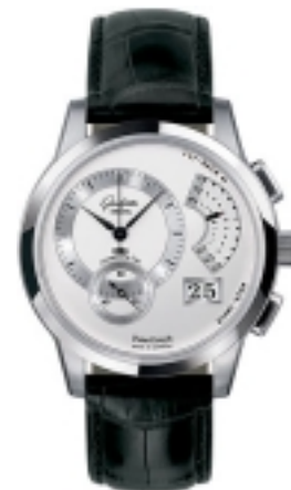
Typ: Herrenarmbanduhr Hersteller: Glashütte Modell: PanoGraph Material: Edelstahl Serien-Nr. 61.01.02.02.04 Individualnr. keine