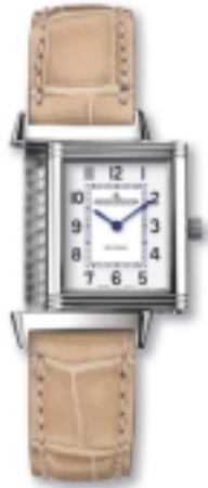
Typ: Damenarmbanduhr Hersteller: Jaeger LeCoultre Modell: Reverso Material: Edelstahl Serien-Nr. 2608410 Individualnr. 2218358