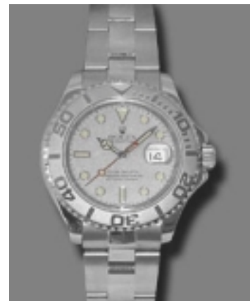
Typ: Damenarmbanduhr Hersteller: Rolex Modell: Yacht-Master Material: 950 PL Serien-Nr. 169622-78730 Individualnr. F711661