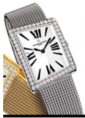
Typ: Damenarmbanduhr Hersteller: Vacheron Constantin Modell: 1972 Large Material: 750 WG Serien-Nr. X25G5465 Individualnr. 756984vac