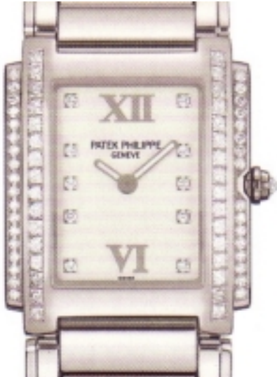
Typ: Damenarmbanduhr Hersteller: Patek Philippe Modell: Twenty-4 Medium Material: 750 WG Serien-Nr. 4910/20G-011 Individualnr. 1673642