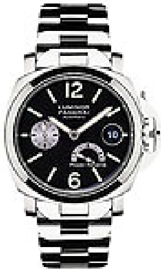
Typ: Herrenarmbanduhr Hersteller: Panerai Modell: Luminor Power Reserve Material: Edelstahl Serien-Nr. PAM00126 Individualnr. OP6575PB 508193