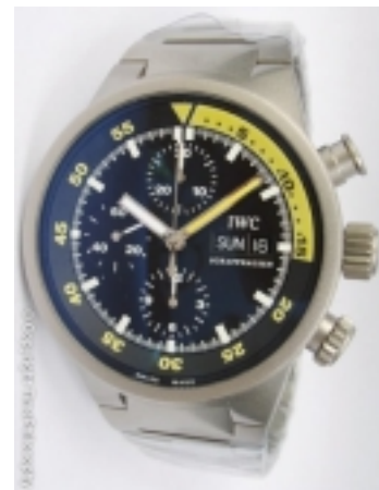
Typ: Chronograph Hersteller: IWC Modell: Aquatimer Material: Titan Serien-Nr. IW371903 Individualnr. 3108110