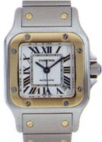
Typ: Damenarmbanduhr Hersteller: Cartier Modell: Santos Material: 750 GG Serien-Nr. W20057C4 Individualnr. 242395663CD