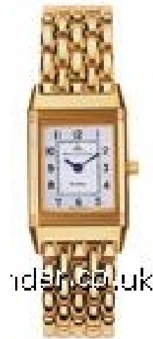
Typ: Damenarmbanduhr Hersteller: Jaeger LeCoultre Modell: Reverso Material: 750 GG Serien-Nr. 2611120 Individualnr. 2122568