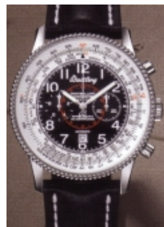
Typ: Chronograph Hersteller: Breitling Modell: Montbrillant 1903 Material: Edelstahl Serien-Nr. A35330 Individualnr. 702554