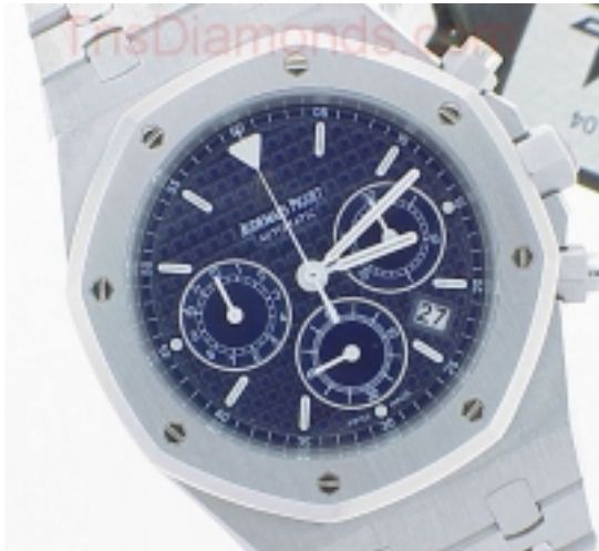
Typ: Chronograph Hersteller: Audemars Piguet Modell: Royal Oak Material: Edeltahl Serien-Nr. 25860ST.00.1110ST.04 Individualnr. F17235-8277