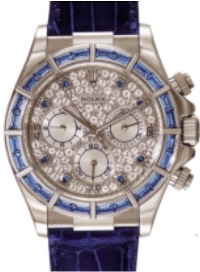
Typ: Chronograph Hersteller: Rolex Modell: Cosmograph Daytona Material: 750 WG Serien-Nr. 116589ABW-16 Individualnr. K592385