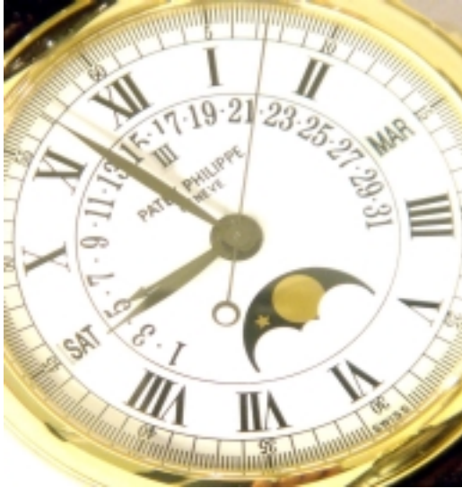
Typ: Herrenarmbanduhr Hersteller: Patek Philippe Model: 5035 Material: 750 GG Serien-Nr. 5035J-013 Individualnr. 31357194178416