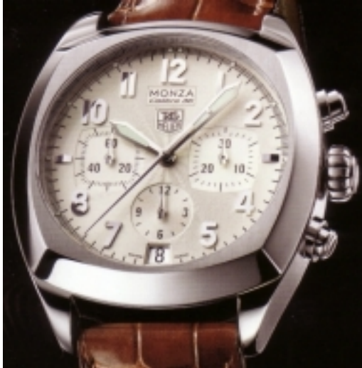
Typ: Chronograph Hersteller: Tag Heuer Modell: Monza Material: Edelstahl Serien-Nr. CR5111.FC617 Individualnr. keine