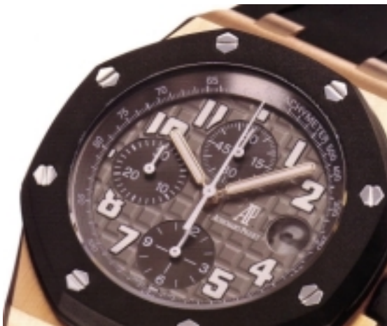
Typ: Herrenarmbanduhr Hersteller: Audemars Piguet Modell: Royal Oak Offshore Material: 750 RG Serien-Nr. 25940OK.00.D002CA.01 Individualnr. F21000-0691