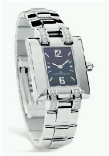
Typ: Damenarmbanduhr Hersteller: Jaeger LeCoultre Modell: Ideale Material: Edelmetall Serien-Nr. 4608521 Individualnr. 2311929