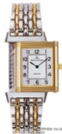
Typ: Herrenarmbanduhr Hersteller: Jaeger LeCoultre Modell: Reverso Material: 750 GG Serien-Nr. 2505120 Individualnr. 2061776