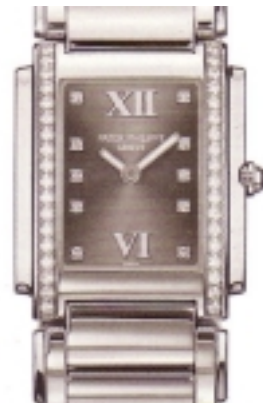
Typ: Damenarmbanduhr Hersteller: Patek Philippe Modell: Twenty-4 Medium Material: Edelmetall Serien-Nr. 4910/10A-010 Individualnr. 33817414299866