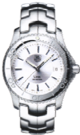
Typ: Herrenarmbanduhr Hersteller: Tag Heuer Modell: Link Material: Edelstahl Serien-Nr. WJ1111.BA0570 Individualnr. keine