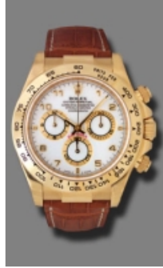
Typ: Chronograph Hersteller: Rolex Modell: Cosmograph Daytona Material: 750 GG Serien-Nr. 116518 Individualnr. Y977321