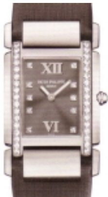
Typ: Damenarmbanduhr Hersteller: Patek Philippe Modell: Twenty-4 Medium Material: 750 WG Serien-Nr. 4920G-001 Individualnr. 33802504287520