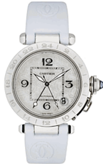
Typ: Damenarmbanduhr Hersteller: Cartier Modell: Pasha C Material: Edelstahl Serien-Nr. W3107199 Individualnr. 2377836264UF