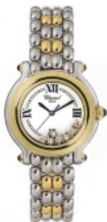
Typ: Damenarmbanduhr Hersteller: Chopard Modell: Happy Sport Material: 750 GG Serien-Nr. 27/8249-23 Individualnr. 1060197