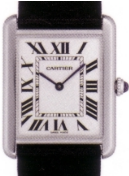
Typ: Herrenarmbanduhr Hersteller: Cartier Modell: Tank Solo Material: Edelmetall Serien-Nr. W1018355 Individualnr. 2715261367PL