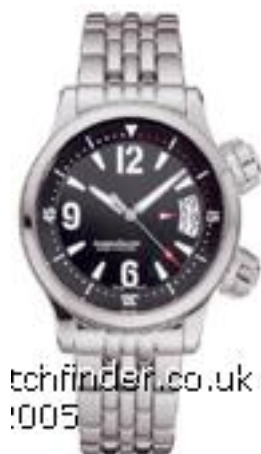
Typ: Herrenarmbanduhr Hersteller: Jaeger LeCoultre Modell: Master Compressor Material: Edelmetall Serien-Nr. 1728170 Individualnr. 309